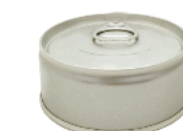
溶接缶 ポケット4号缶