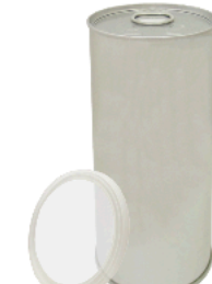
溶接缶 アルミトップ缶