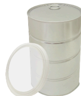
溶接缶 アルミトップ缶(ビード入り)

100, 96, 92, 84, 74.5, 65φ × 75~225H 胴体天面：アルミ箔 蓋：ポリ蓋