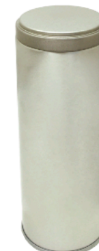
溶接缶 ストレート押し蓋缶

100, 84, 74.5, 65φ × 75~225H 胴体天面：アルミトップ 蓋：ポリ蓋