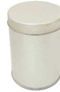
溶接缶 被せ薄蓋缶