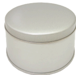
ロック缶 外カール蓋缶