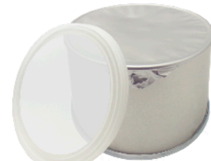
溶接缶 アルミ箔缶

102, 96, 92, 90, 86, 84, 77, 74.5, 71.5, 65φ × 80~236H 胴体天面：アルミ箔 蓋：ブリキ蓋