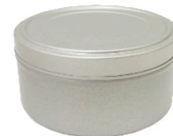
2ピース缶 2ピース丸缶