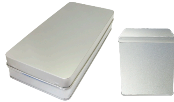
ロック缶 長方形缶