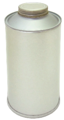
溶接缶 オイルタイプ缶