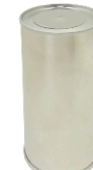
溶接缶 粉末調味料缶

85φ×100~200H 53φ×110~200H 蓋：山高ネジ蓋 備考：PE中栓