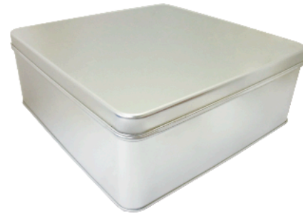
ロック缶 正方形缶