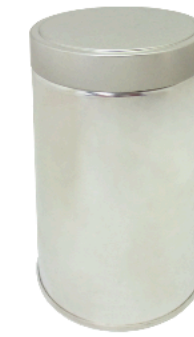
溶接缶 ストレートネジ蓋缶