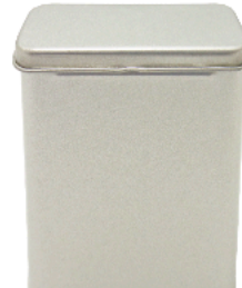
ロック缶 エイド缶

84φ×120~190H 53φ×80~200H 胴体天面：アルミトップ 蓋：ポリ蓋 備考：プラ回転盤可. アルミトップ穴開けにてシール貼り